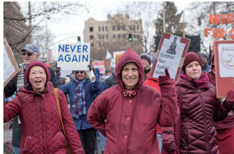
圖丹卻准法師呼籲社會大眾關注政策問題，法師帶領僧團在斯波坎（Spokane）參加反對槍枝氾濫的遊行。

會。我們會很鮮明地表達身為佛教徒的價值觀，以及如何將其應用於政策問題，例如希望槍枝受到控管、反對性侵及暴力、支持「#MeToo」運動、相信氣候變遷是存在的……我們會直接說出意見，並呼籲社會大眾關注這些問題，但是不會告訴公眾該投票給哪一位候選人。